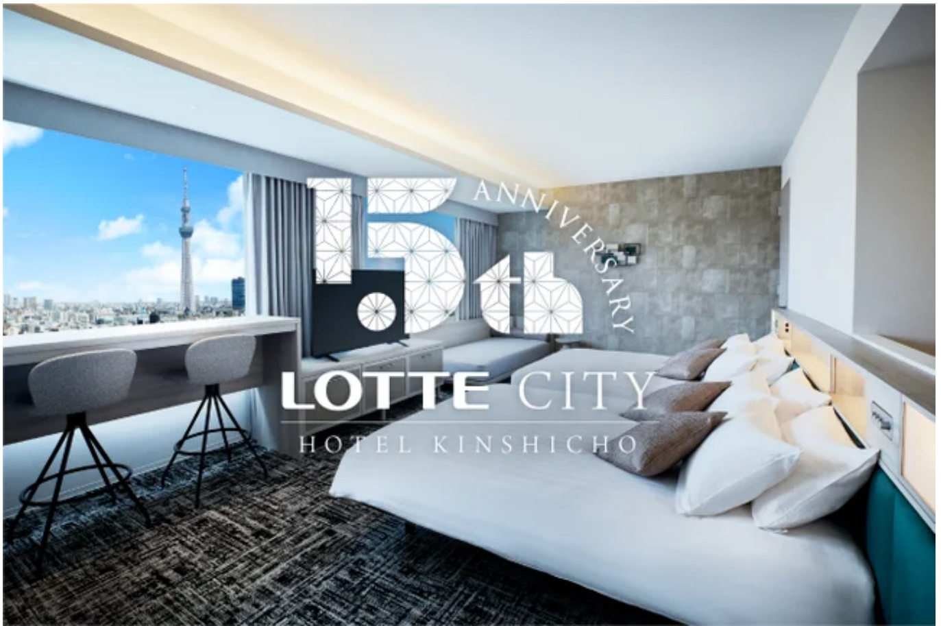
ロッテシティホテル錦糸町15周年イメージ画像

2025年はホテル開業15周年のアニバーサリーイヤー。「あらたな景色、上質な時を紡ぐ」をコンセプトに、ロッテシティホテル錦糸町でしか味わえない、心を揺さぶる体験を創出いたします。