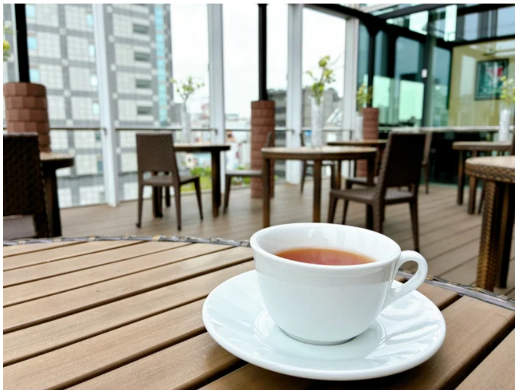
レストラン「シャルロツテ」テラス席（イメージ）

ヨガの後には、ドリンクを片手に参加者同士が語り合う「トークセッション」をご用意。夜景を眺められるテラスで、心地よい風を感じながら親睦を深められます（天候状況により店内で実施）。