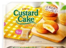
カスタードケーキパーティーパック