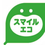
スマイルエコラベル

ロッテは、環境に配慮する取り組みを、お客さまにわかりやすく伝えるため、「スマイルエコラベル」を製品の容器や包装に順次表示しています。当社独自の環境配慮基準をクリアした製品が対象で、当該リリースに掲載の製品にも順次表示していきます。