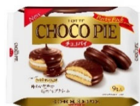
チョコパイパーティーパック

2020年から本取り組みを段階的に進め、トレーの厚みを0.35mmから0.31mmに変更し、プラスチック使用量を約11%の削減(注2)を実現しました。今回の変更では、耐衝撃強度を保つため、トレー側面の縦線（リブ）の本数を増やし、横方向の段差をあらたに追加しています。本取り組みによる原料の削減量としては年間約83.0トン(注3)見込んでいます。注2、注3 2019年製品基準比