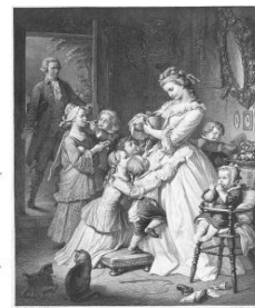
社名の由来である “若きウェルテルの悩み”のヒロイン 「シャルロット」