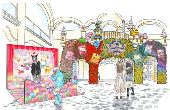
▲3F エントランスホールフォトスポット（イメージ）

3F エントランスホールには、推し活にもぴったりなフォトスポットが登場します。「お口の恋人ロッテ」のチョコレートとコラボレーションしたかわいいフォトスポットでは、ステージに立っているような写真の撮影が可能です。推しグッズと一緒に撮影をすると、カラーに映えた写真で推し活をお楽しみいただけます。