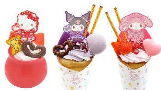
▲スペシャルコラボレーションメニュー

イベント期間中は、3F エントランスホールに登場するフォトスポットに加えて、ピューロランド限定でオリジナルパッケージのガーナチョコレートを数量限定で販売します。パッケージを組み立てると、アクリルスタンドを飾ることができるステージのようなフォトスポットに大変身します。また中に入っているガーナミルクの外箱にメッセージを書いて、誰かに気持ちを伝えることができます。