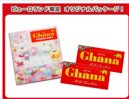
▲ピューロランド限定 オリジナルパッケージのガーナ