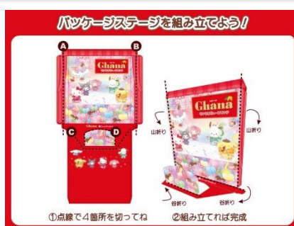
▲オリジナルパッケージのガーナ （組み立てイメージ）