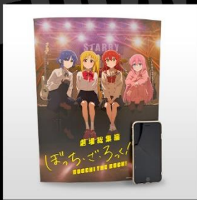
なんと35x27.5cmの ビッグサイズ iPhoneSEと比較してこの存在感