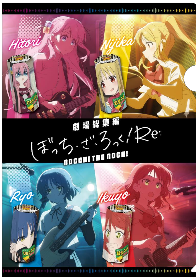
オリジナルクリアファイル（表）