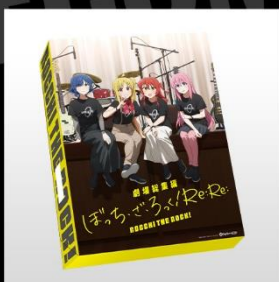
劇場総集編の後編仕様の オリジナルビッグサイズBOX