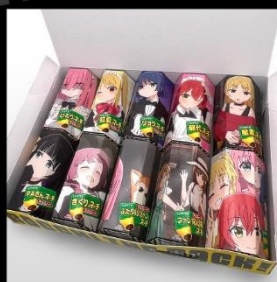
箱をあけると キャラクターたちがお出迎え! 10本並べると圧巻!