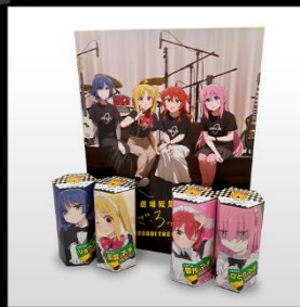
オリジナルボックスのまわりに 6角ボックスを置いて 飾ることもできます