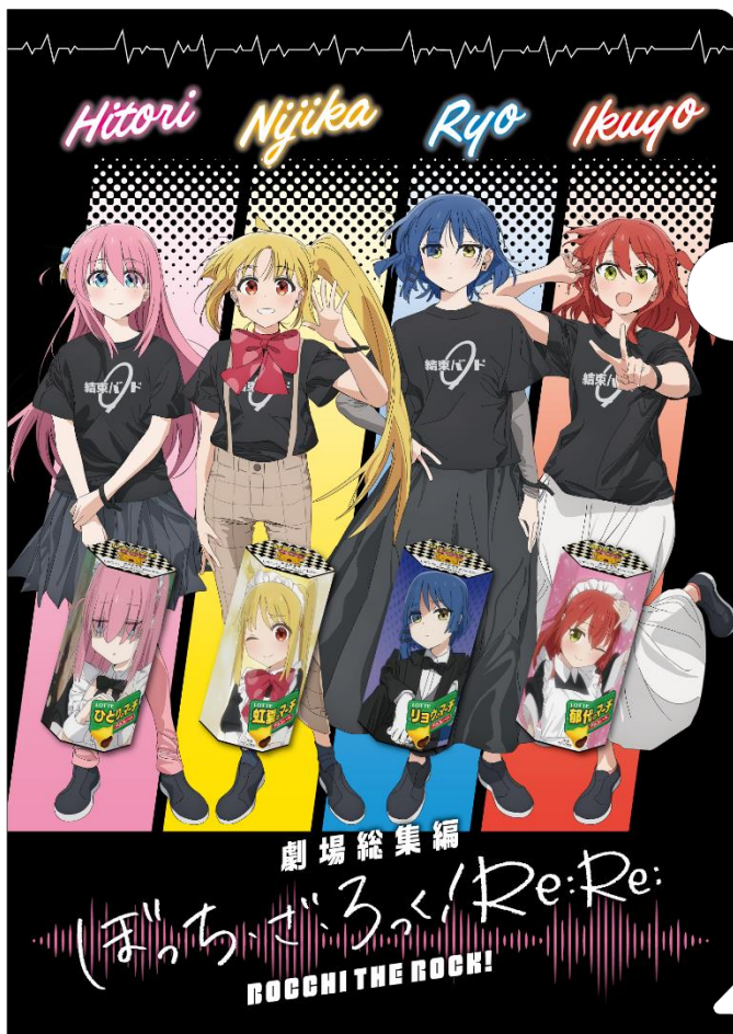
オリジナルクリアファイル（表）