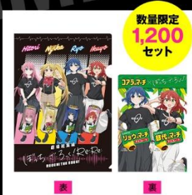
劇場総集編ぼっち・ざ・ろっく! Re:Re:のマーチ オリジナルクリアファイル