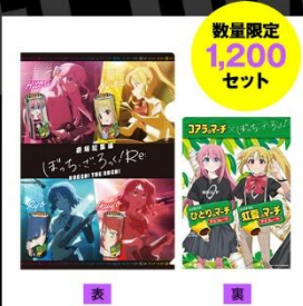
劇場総集編ぼっち・ざ・ろっく! Re:のマーチ オリジナルクリアファイル

第1回販売期間の8月8日(木)正午~8月18日(日)にご注文いただいた方に、数量限定で、ここでしか手に入らないオリジナルクリアファイルをプレゼント!