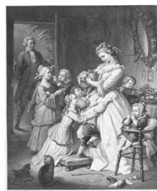
社名の由来である “若きウェルテルの悩み”のヒロイン 「シャルロット」