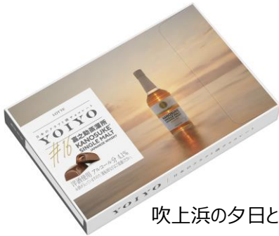
吹上浜の夕日とボトル