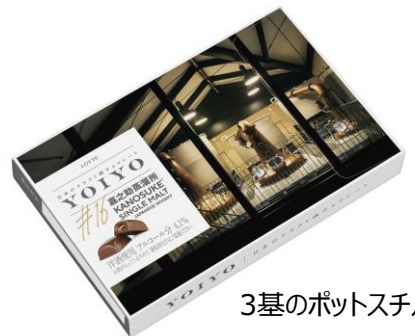
3基のポットスチル