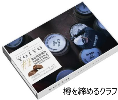
樽を締めるクラフトマン