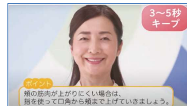
3. 検査結果に基づき、楽しく続けられるトレーニングメニューを紹介