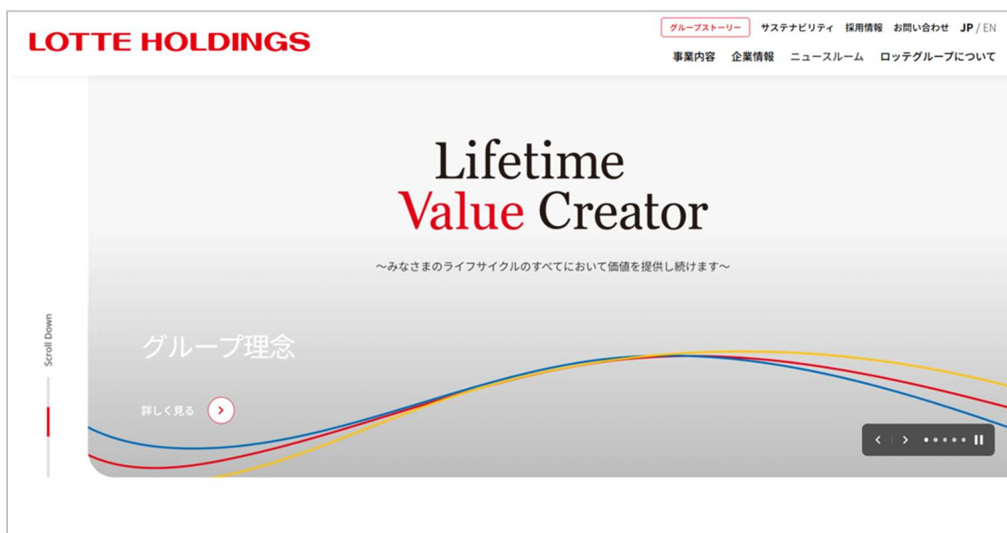
[新コーポレートサイト トップページキービジュアル]

それぞれ「食品」「ライフサイエンス&デジタル」「ライフスタイル&エンターテインメント」の3事業を意味し、これらが重なり合いながら大きくなつねり（成長）を生み出すイメージを表現しています。